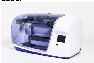
Skener BlueScan Software Dr Dot: