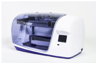
Skener BlueScan Software Dr Dot: